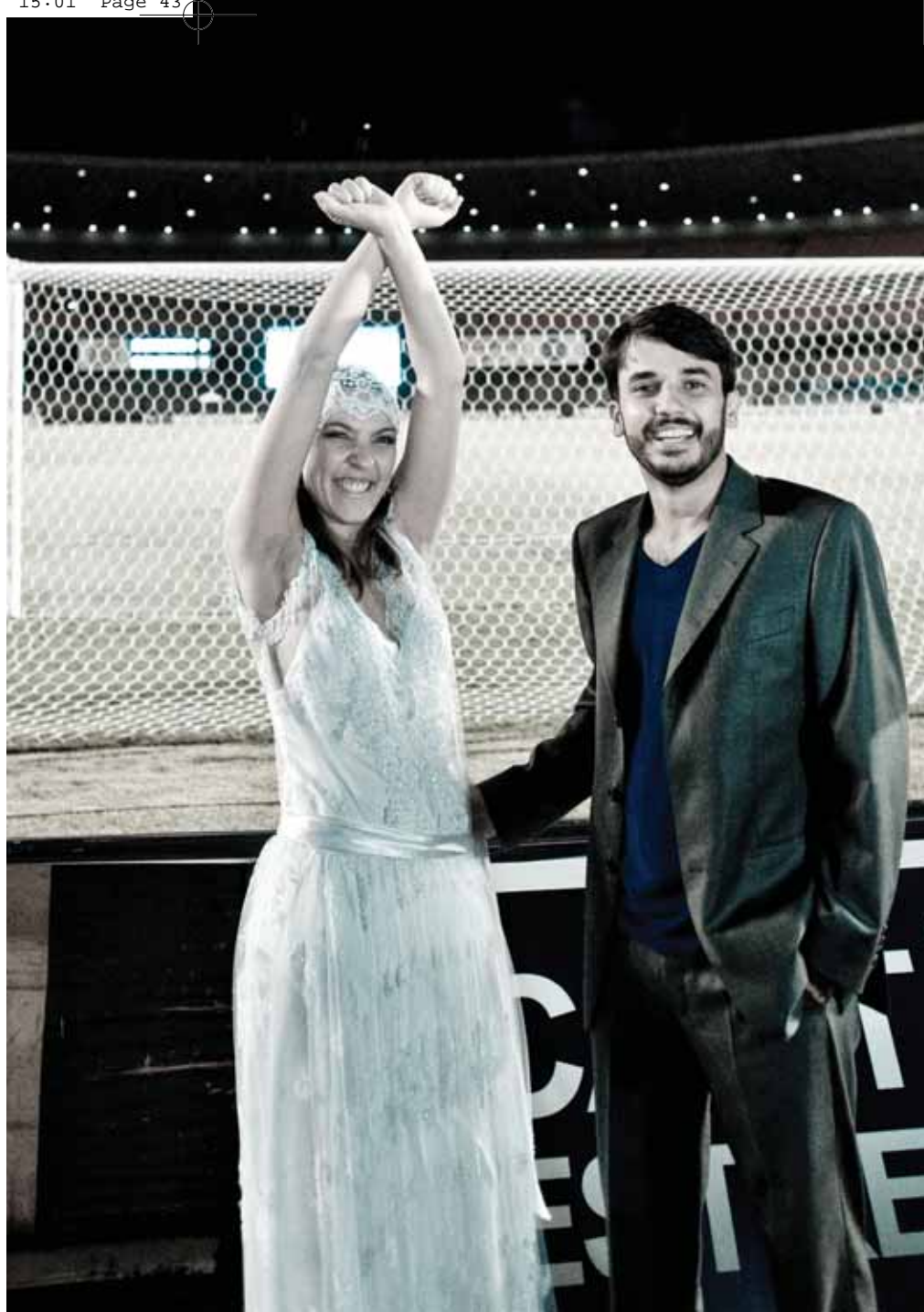
Os noivos entram em campo vestidos com os trajes tradicionais, antes do jogo começar

No campo de futebol, Vinicius usou as luzes do estádio para iluminar a cena, além de um flash remoto para preencher as sombras no rosto. Ele teve apenas cinco minutos para fotografar, além de dividir o tempo e o espaço com demais fotógrafos e cinegrafistas que estavam lá para cobrir o jogo; "muitos não