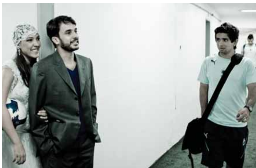
Flagrante durante o ensaio: casal cruza com jogadores do Cruzeiro nos corredores do estádio