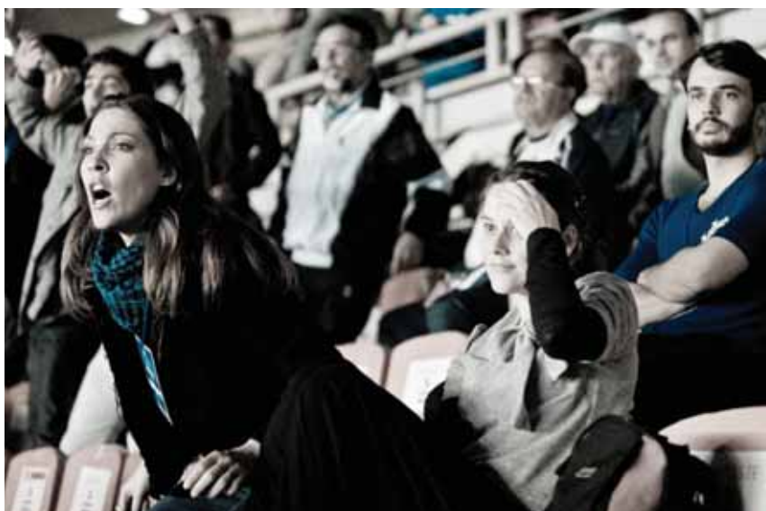
Mesmo sem os trajes tradicionais, o fotógrafo clicou o casal na arquibancada e optou por deixar as fotos do ensaio em tom azulado – cor do Cruzeiro, time favorito do casal