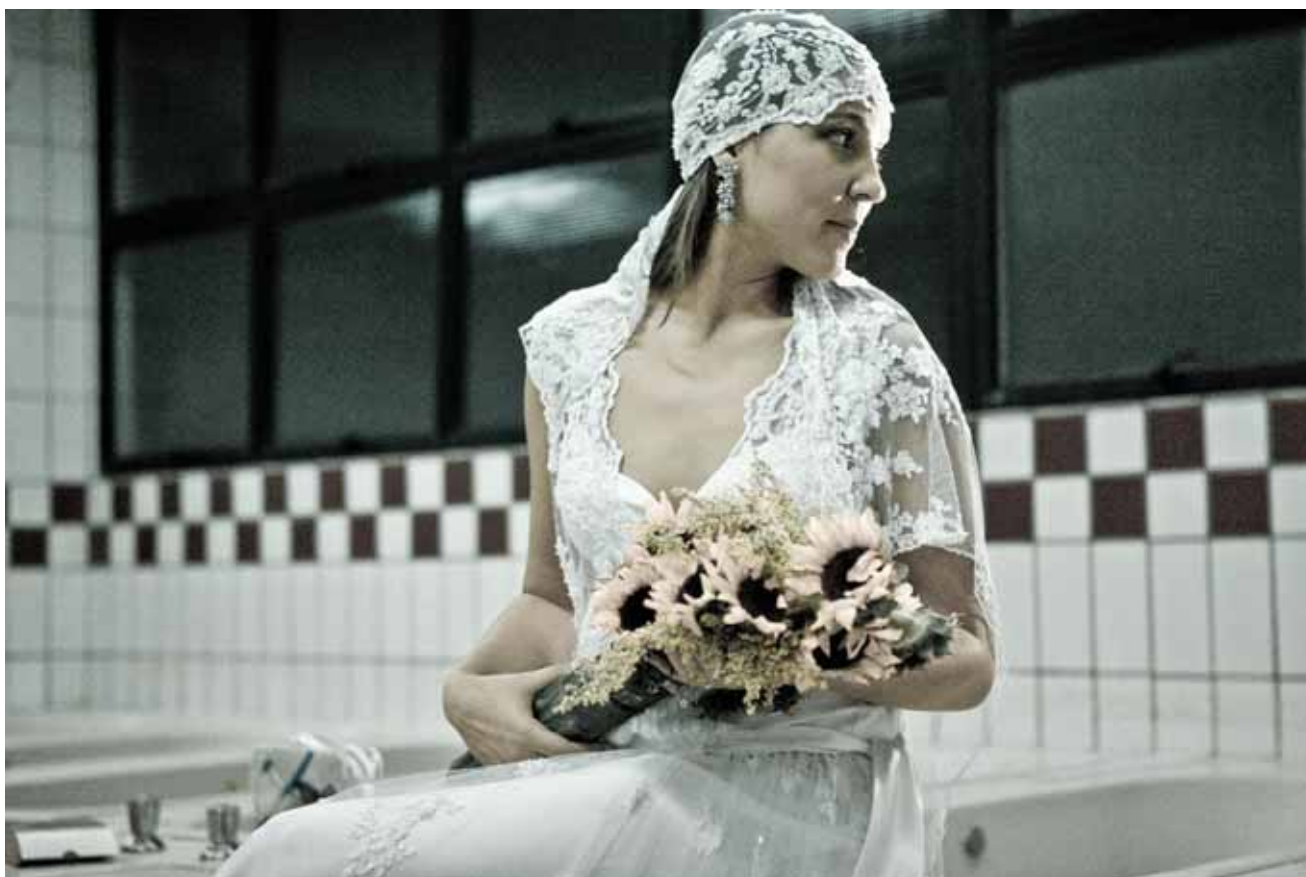
Acima, uma das fotos do book realizada dentro do vestiário do estádio do Mineirão; abaixo, o making of da imagem acima: o fotógrafo, que utilizou a luz de uma lanterna para criar brilho lateral no rosto da noiva misturando a iluminação com a luz ambiente disponível no local