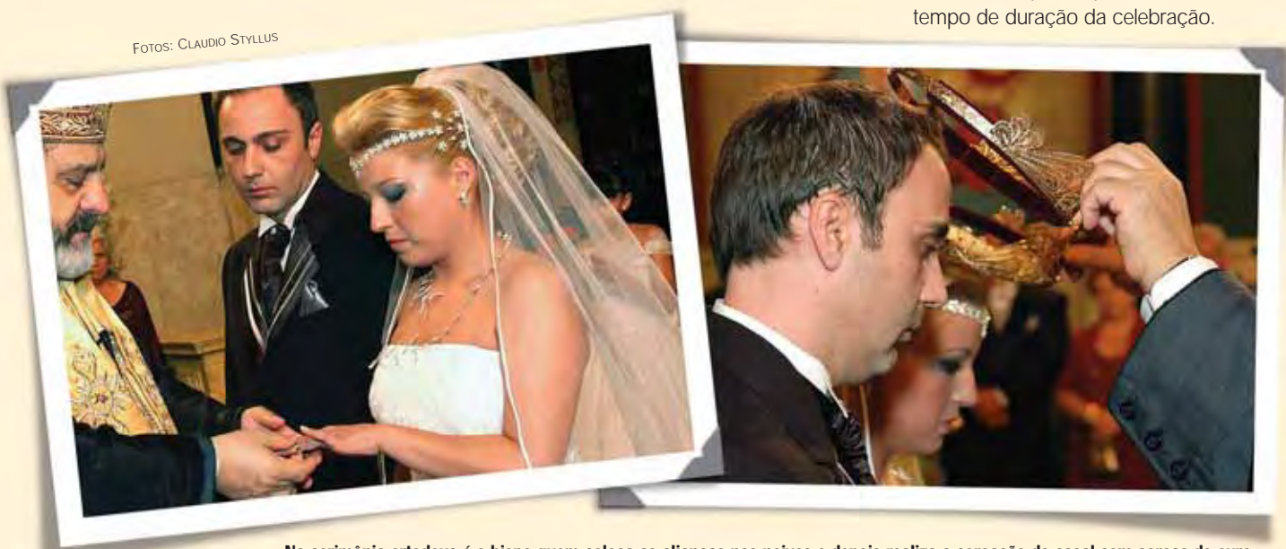
Na cerimônia ortodoxa é o bispo quem coloca as alianças nos noivos e depois realiza a coroação do casal com coroas de ouro