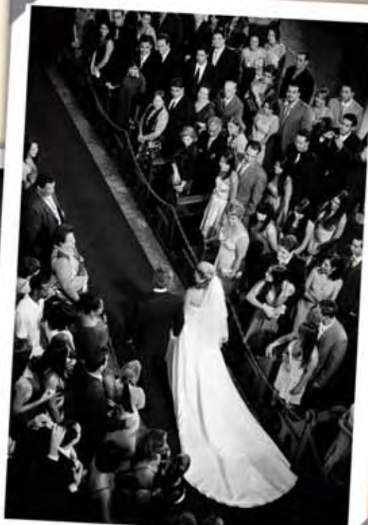
No casamento católico tradicional, a troca de alianças e a entrada da noiva são momentos muito importantes da cerimônia