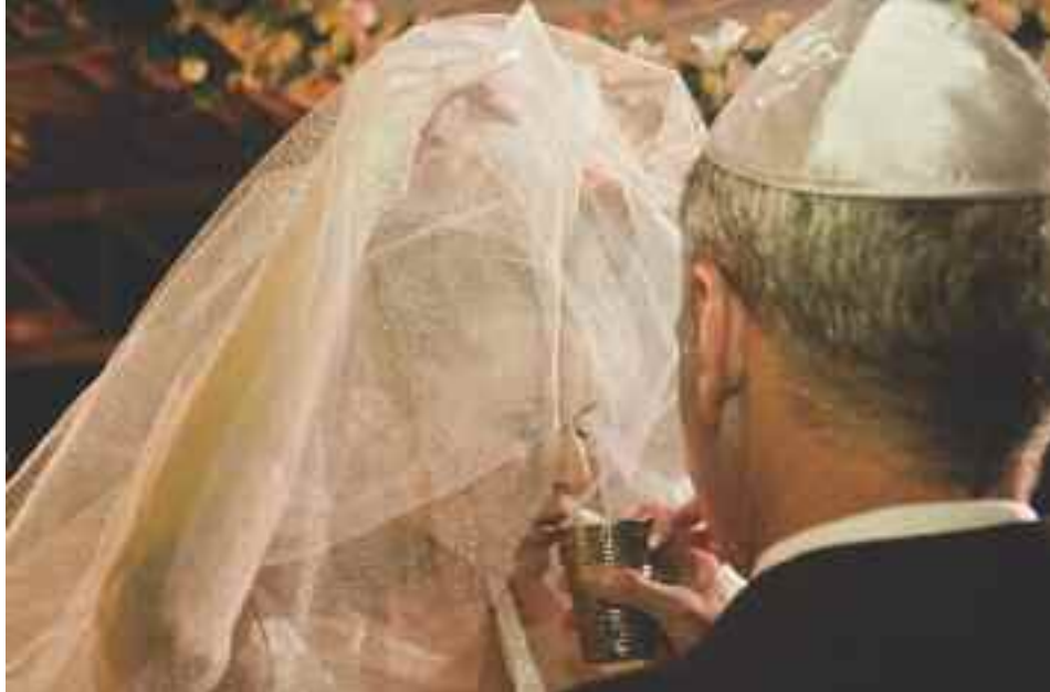
Mais cenas de um ritual judaico: a noiva bebe um cálice de vinho

Ele sugere que o profissional de imagem sempre procure conversar antes com o padre, pastor ou rabino que irá celebrar o matrimônio. Perguntas importantes como em qual momento não se deve fotografar ou usar flash, locais onde não se pode ficar e até mesmo vestimentas devem ser feitas para que surpresas desagradáveis não ocorram.