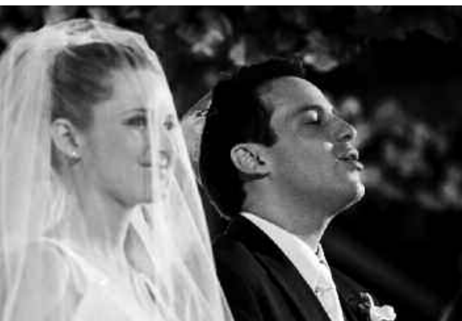
Durante o ritual, a noiva em um casamento judaico fica coberta pelo véu

são sistemáticos e rigorosos. Por mais que você insista, a celebração não pode ser interrompida ou refeita somente para que você refaça a foto”, ensina o especialista.