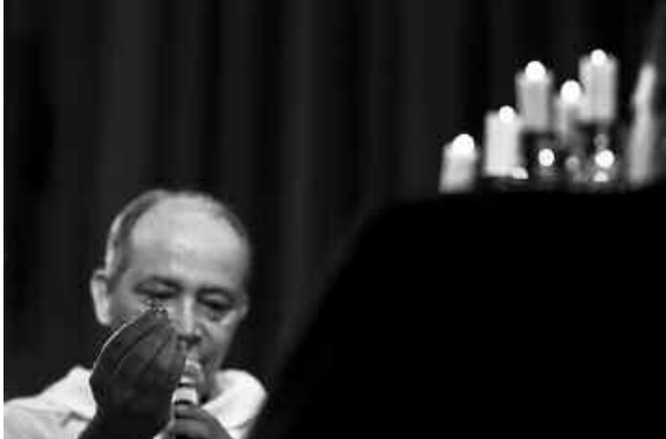
Durante a bênção das alianças procure ângulos diferenciados, caso vários fotógrafos da equipe estejam voltados para este momento

Quando chegar o momento da bênção das alianças, é muito importante que pelo menos um fotógrafo esteja presente para o registro. Se acontecer de outros estarem presentes, o especialista indica que cada um combine de fazer a captura de maneiras diferentes, um dando atenção ao ângulo mais aberto e o outro ao