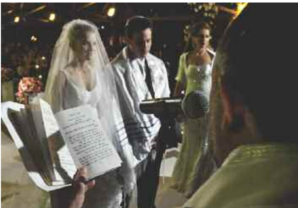
Acima, o rabino faz a leitura da Torá (o livro sagrado do povo judeu); abaixo, o noivo quebra o copo: o fotógrafo deve estar atento aos rituais