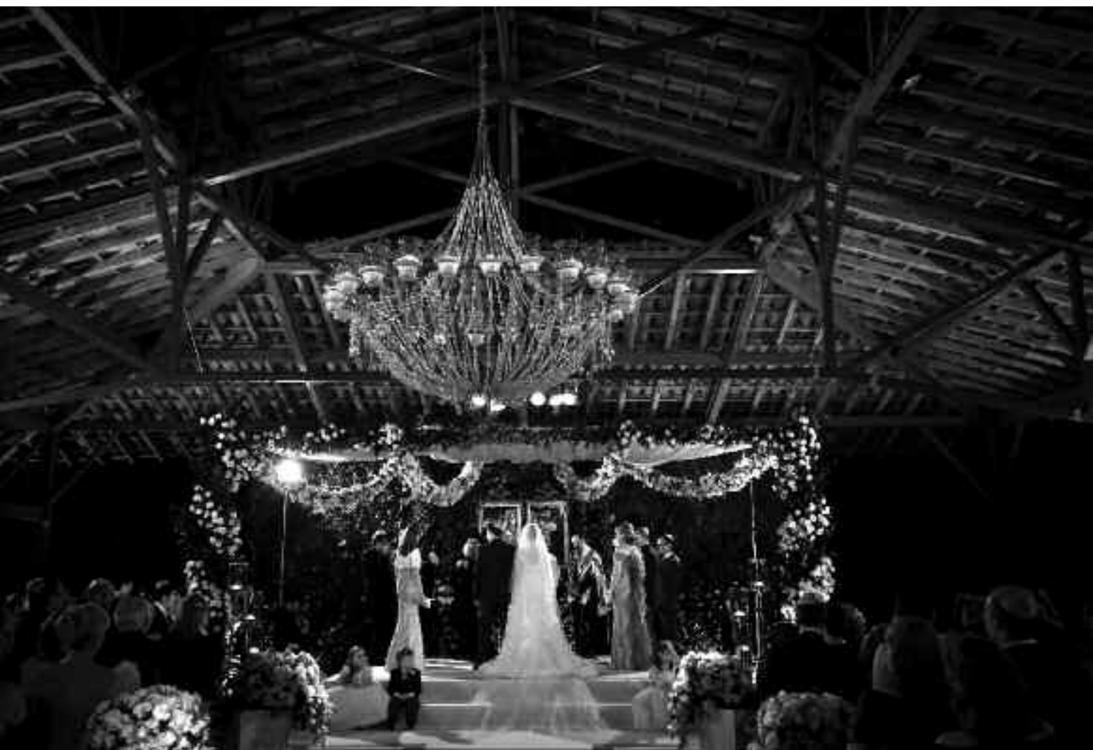
Acima, um casamento judaico: é fundamental que o fotógrafo tenha um mínimo de conhecimento sobre religiões